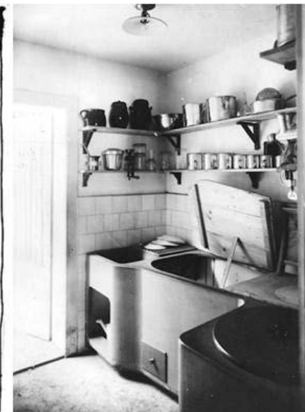
Margarete Schütte-Lihotzky - "La cucina di Francoforte"