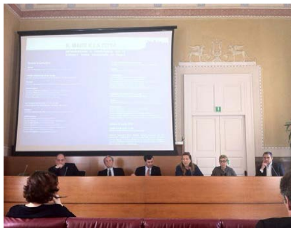
I lavori del convegno